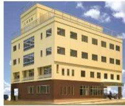
ケアサポート すわ